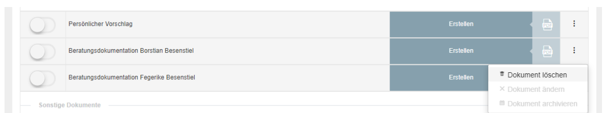
Abbildung 2: Die Option „Dokument Löschen“ ist immer bei der Beratungsdokumentation verfügbar

Aktuell kommt es manchmal vor, dass sich Beratungsdokumentationen nicht löschen lassen. Mit dem Update am 15.11. wird es die Möglichkeit geben diese immer aus der Dokumentenmappe zu entfernen.