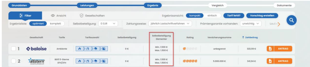
Abbildung 2: "Selbstbeteiligung Elementar" als neue Spalte in der Ergebnisübersicht

Die neue Spalte "Selbstbeteiligung Elementar" in der Ergebnisübersicht sorgt für mehr Transparenz und erleichtert die Auswahl durch eine direkte Vergleichbarkeit.