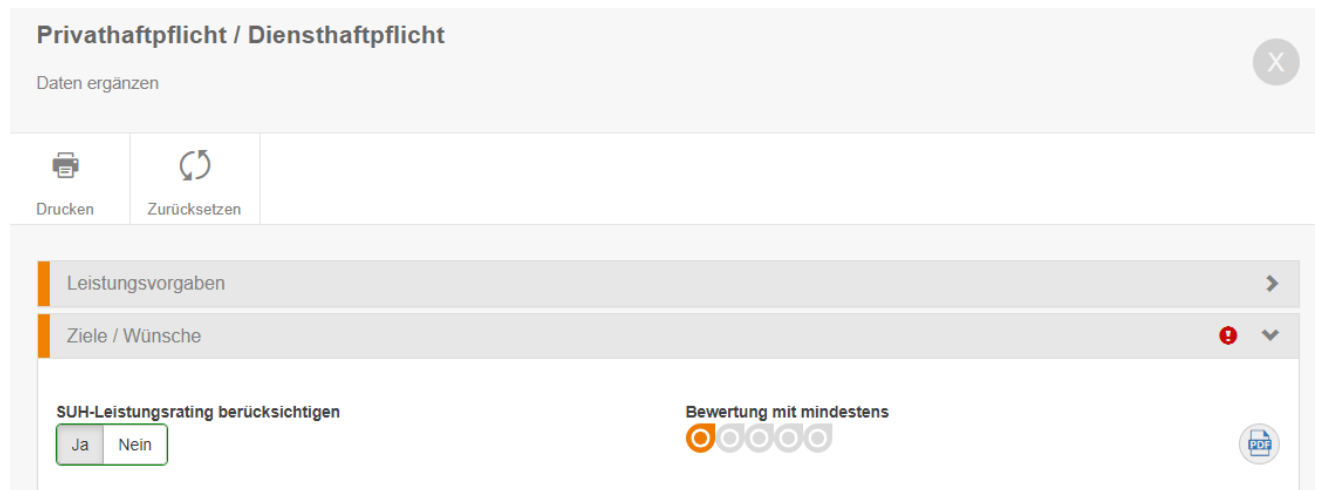
Abbildung 3: Titel auf der Ziele/Wünsche Maske